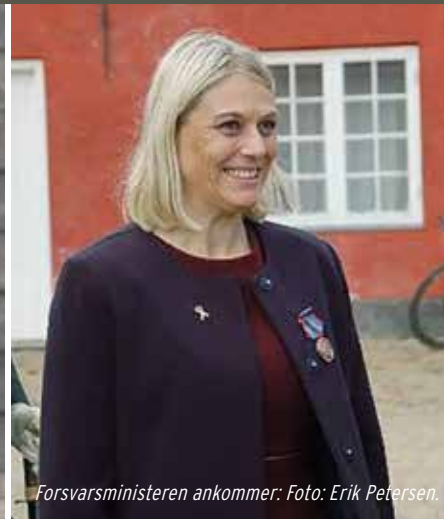
Forsvarsministeren ankommer: Foto: Erik Petersen.