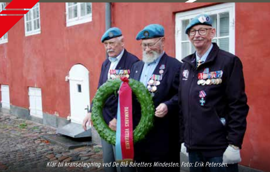
Klar til kranselægning ved De Blå Baretters Mindesten.