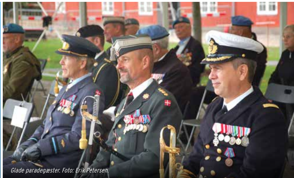
Glade paradegæster.

Forsvarsministeren takkede tidligere og nuværende veteraner for deres indsats, og understregede, at der blev arbejdet hårdt for at få udestående erstatningssager afklaret.