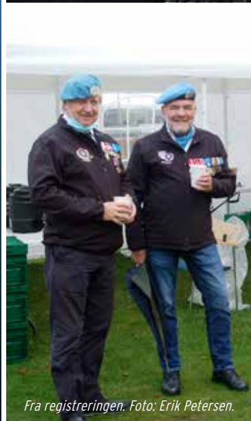
Fra registreringen.