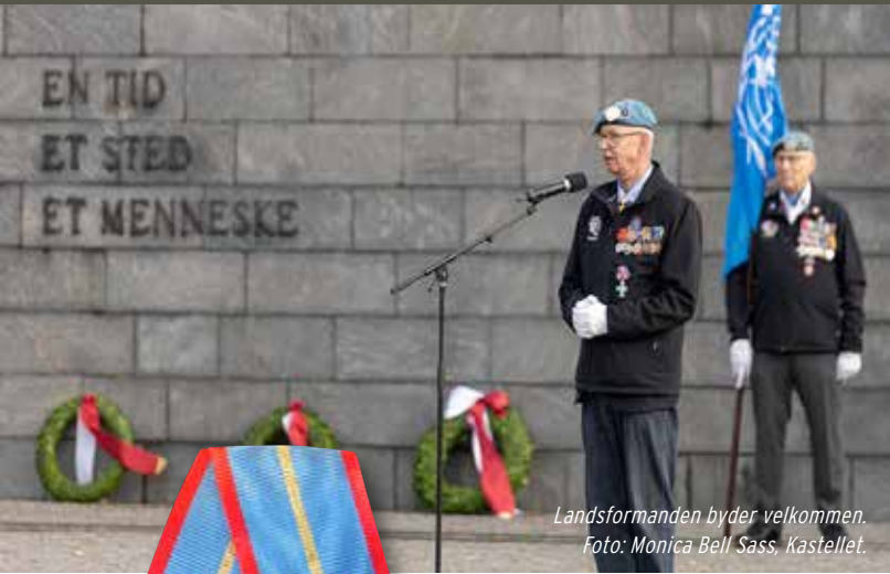
Landsformanden byder velkommen.