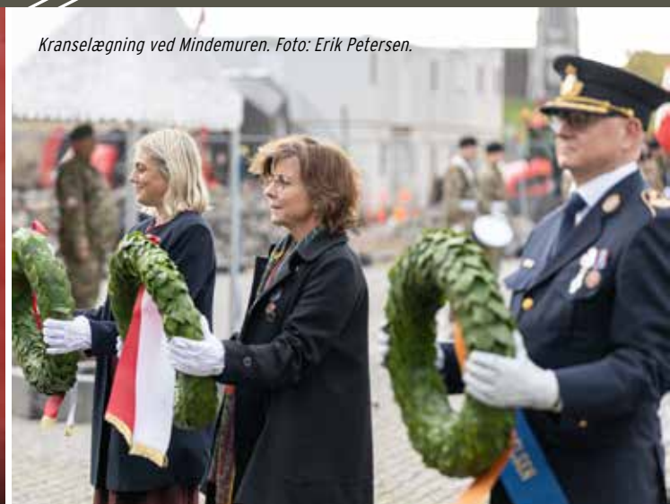
Kranselægning ved Mindemuren.