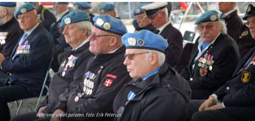
Veteraner under paraden.