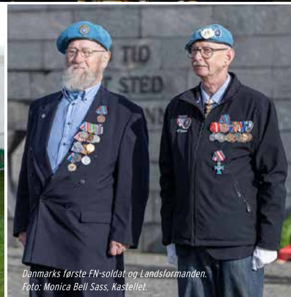
Danmarks første FN-soldat og Landsformanden.