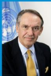
Jan Eliasson UNGA president in 2005 when R2P was adopted