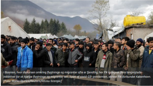
I Bosnien, hvor diskursen omkring flygtninge og migranter ofte er fjendtlig, har FN igangsat flere langsigtede initiativer for at hjælpe flygtninge og migranter set i lyset af covid-19-pandemien, skriver FN-forbundet København.

DEBAT: Covid-19 har vist os, at vi ikke bare kan lukke grænser og ignorere udviklingen uden for Danmark. Derfor skal regeringen investeres i FN's forebyggende og afhjælpende indsatser for flygtninge og migranter på globalt plan, skriver FN-forbundet København i anledning af FN's Flygtningedag lørdag.