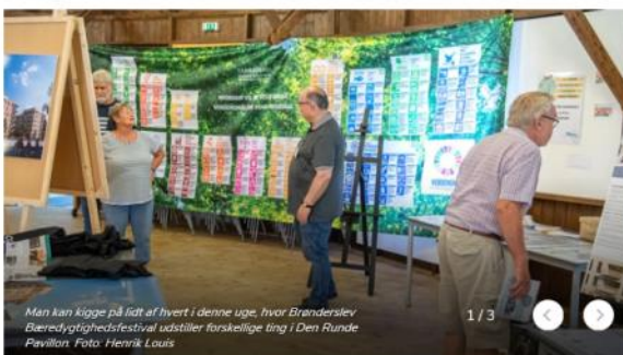
Man kan kigge på lidt af hvert i denne uge, hvor Brønderslev Bæredygtighedsfestival udstiller forskellige ting i Den Runde Pavillon.