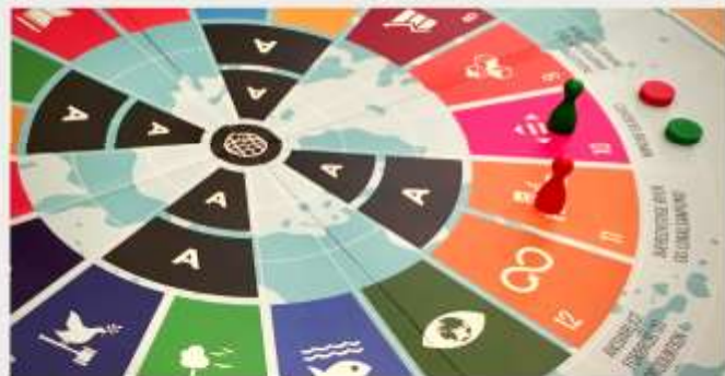
Brætspillet henviser til udstillingen og engangsbænkede og er relevant i f.eks. samfundsfag, geografi, historie, dansk og biologi.