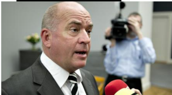
Søren Espersen er udenrigsordfører for Dansk Folkeparti og var før folketingsvalget i juni formand for Det Udenrigspolitiske Nævn.

Den 27. juli i år skriver Søren Espersen på Twitter: