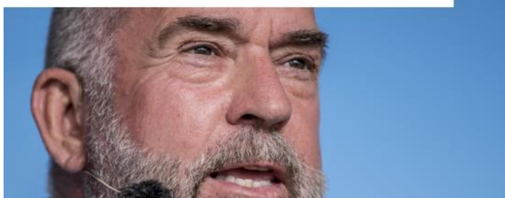
Søren Espersen kalder det fluekneperi i at undersøge, hvorvidt han ret i sin påstand om, hvad der står i en resolution om Israel.

Søren Espersen (DF) er ifølge ekspert "ude hvor han ikke kan bunde".